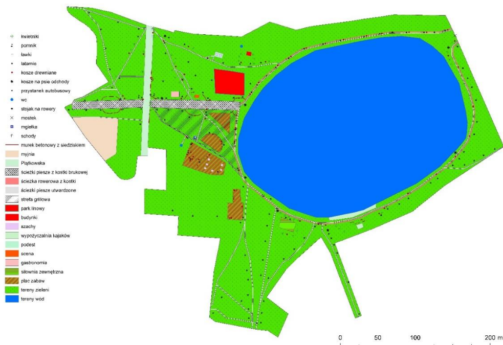
Rycina 1. Zagospodarowanie parku w Zgierzu

alejki spacerowej w zachodniej części parku), dwa pomniki (T. Kościuszki i W. Łukasińskiego – oba wzdłuż głównej alejki spacerowej, w zachodniej części parku), stoły do gry w szachy, murki z miejscami do siedzenia (wzdłuż głównej alejki spacerowej), toaletę (w zachodniej części parku). Ponadto w pobliżu placu zabaw – na zachód od zbiornika wodnego, została wyznaczona strefa grillowa o powierzchni ok. 0,4 ha. Na rycinie 1 przedstawiono zagospodarowanie parku według stanu na sierpień 2016 r.